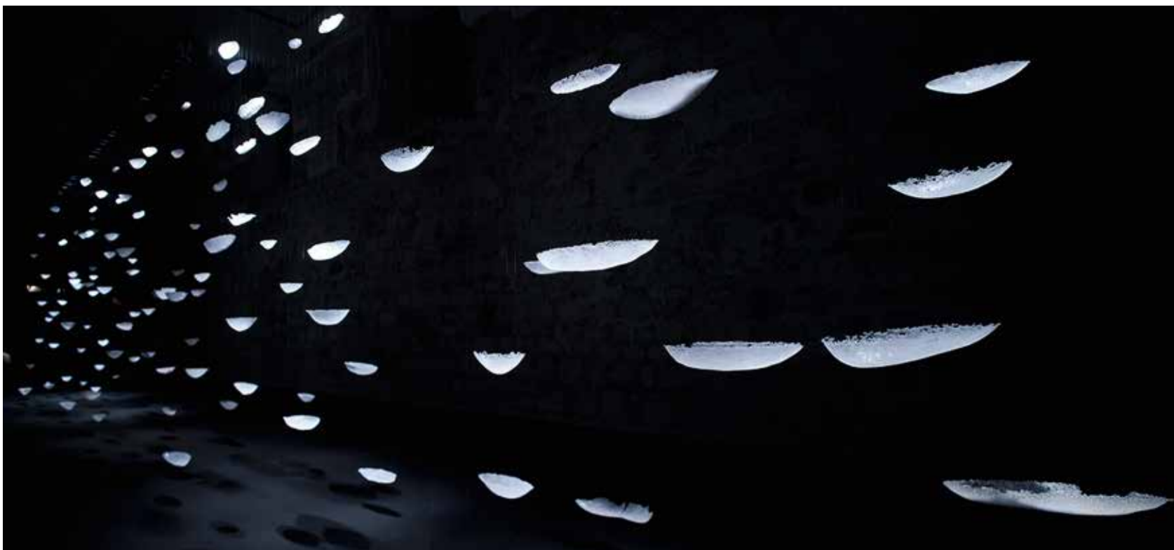
Odsanjanja / Dreaming Away, multimedijška prostorska postavitve na Ljubljanskem gradu, steklo, svetloba, glasba Arvo Pärt (Spiegel im Spiegel), dolžina postavitve 30 metrov, 2011

prostor dihanja in Biti . V njem izraža odprtost horizontov specifičnih pokrajin, tudi notranjih, in plasti subtilnih občutij.