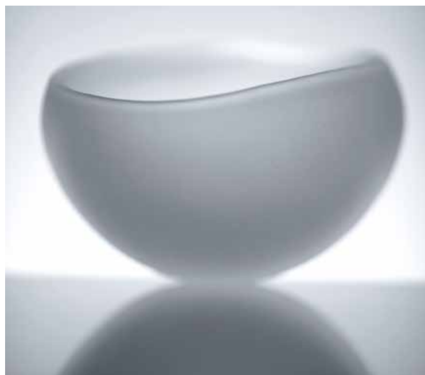
Soft, skodelica