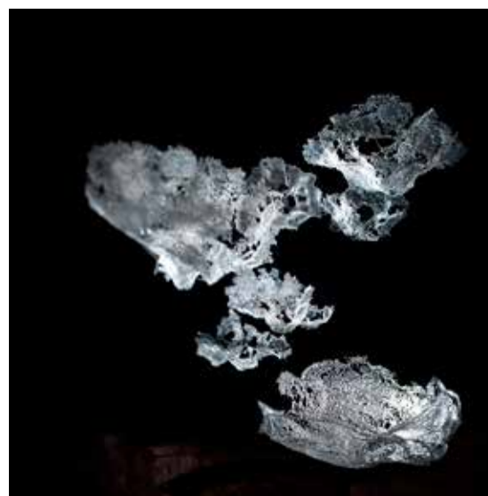
Rêveries / Pointe, steklo, 5 x 5 x 5 m

Predava na mednarodnih konferencah oblikovanja in umetnosti v steklu ter gostuje v studiih in galerijah po svetu, med drugim je bila prejemnica rezidenc s štipendijo v ustanovah The Corning Museum of Glass (New York), Creative Glass Center of America (New Jersey), Bullseye Education and Research Center (Oregon) in Pilchuck Glass School (Washington), vse v ZDA, ter letos v Cill Rialaighu na Irskem in v Musée du verre v Franciji. Potuje tudi, da raziskuje posebne kraje, ki jo navdihujejo, kot se sama izrazi, skozi trenutke kontemplacije, iskanja širine diha in stanja miru. Svoje občutke ob doživljanju teh drugačnih prostorov prevaja v steklo, skozi katero razmišlja o pojmu beline – ta ji pomeni tišino, krhkost, neizmernost,