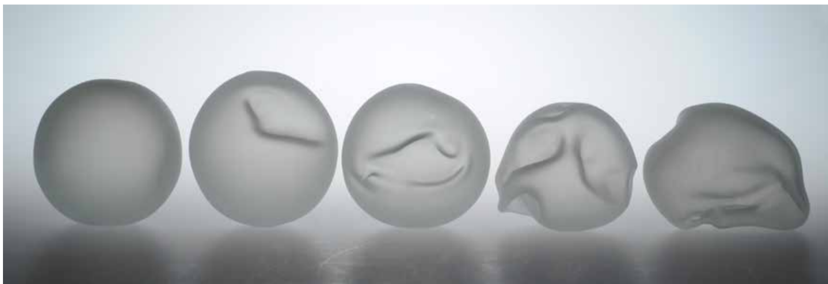
Zgodba o dihu, steklo, 2014–2018