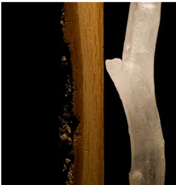
Znotraj – I held my breath but the world kept on dreaming, les, steklo, detajl iz prostorske postavitve na Ljubljanskem gradu, 2012