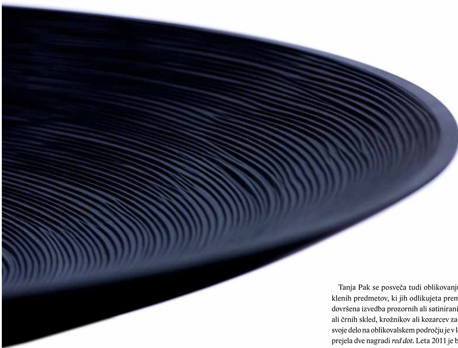
Črna, 40 cm krožnik

Tanja Pak se posveča tudi oblikovanju uporabnih steklenih predmetov, ki jih odlikujeta premišljena oblika in dovršena izvedba prozornih ali satiniranih površin – belih ali črnih skled, krožnikov ali kozarcev za dnevno rabo. Za svoje delo na oblikovalskem področju je v letih 2008 in 2009 prejela dve nagradi red dot . Leta 2011 je bila imenovana za oblikovalko leta v Sloveniji.