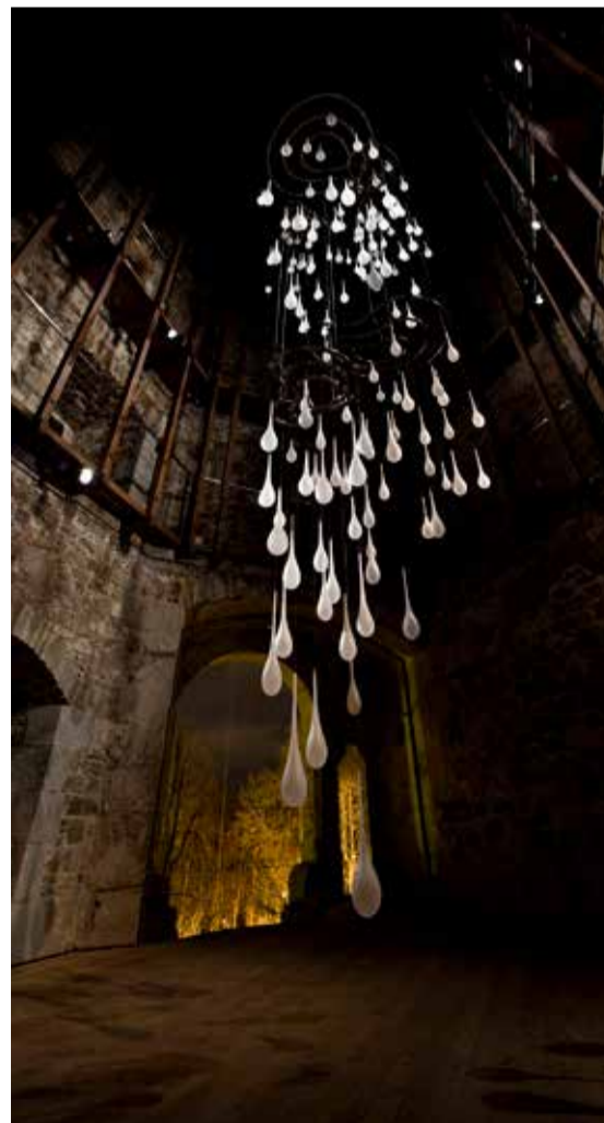
Hip zatem – Alina, prostorska postavitve, peterokotni stolp na Ljubljanskem gradu, steklo, inoks, svetloba, glasba Arvo Pärt (Für Alina), višina 15 m, 2011