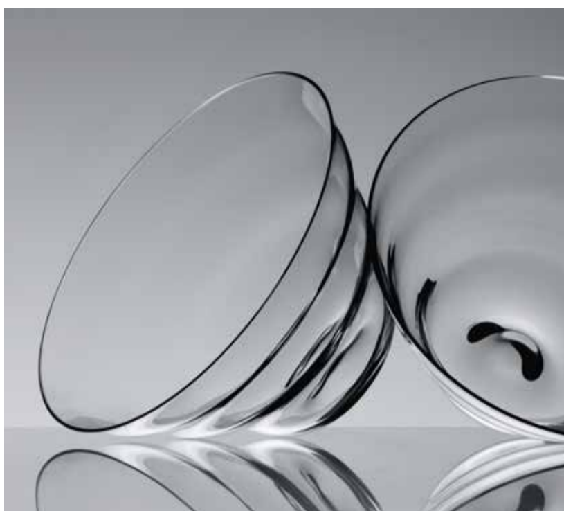
Flow, skodelica, fotografija Peter Koštrun