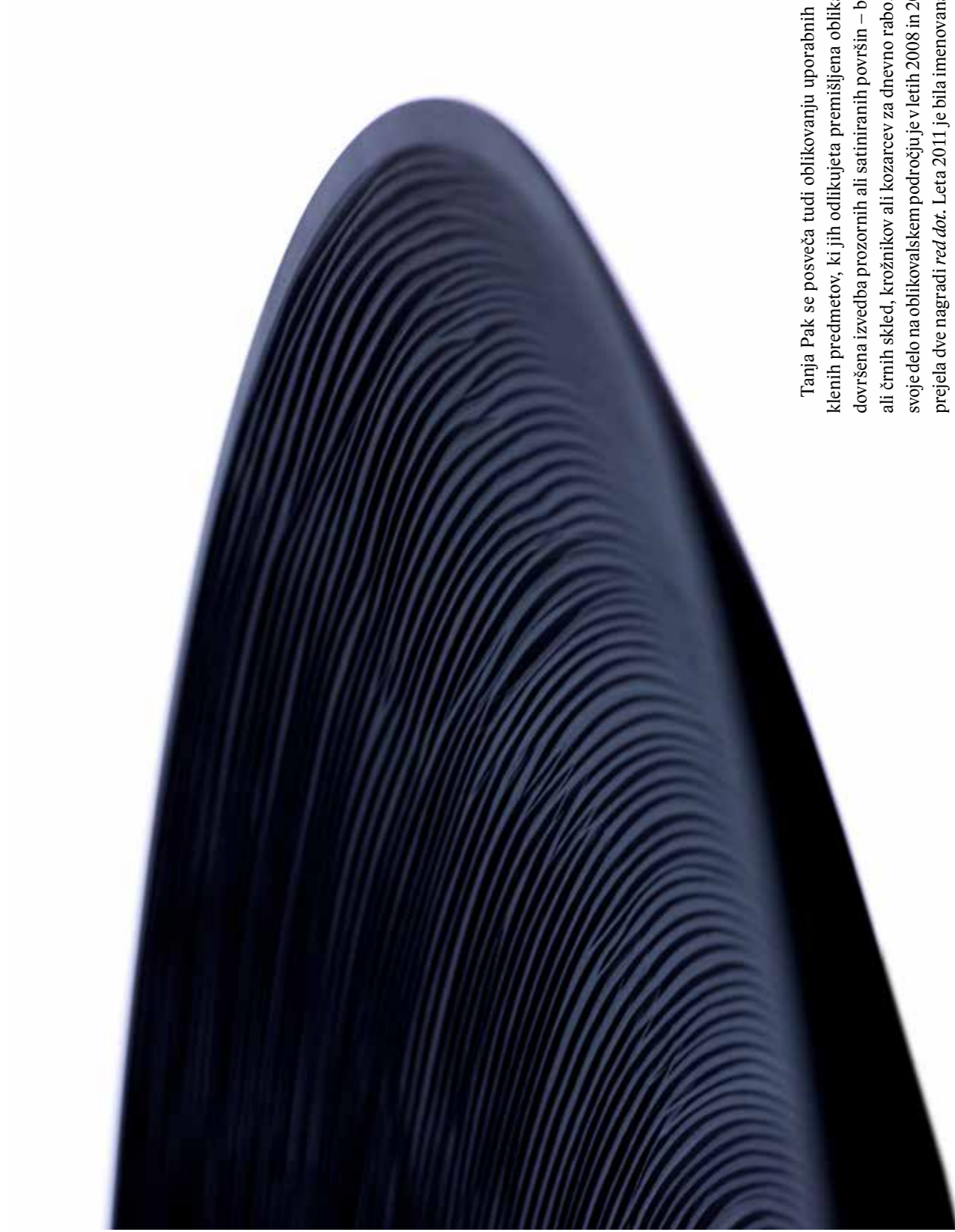
Črna, 40 cm krožnik, fotografija Peter Koštrun

Tanja Pak se posveča tudi oblikovanju uporabnih steklenih predmetov, ki jih odlikujeta prečiščena oblika in dovršena izvedba prozornih ali satiniranih površin – belih ali črnih skled, krožnikov ali kozarcev za dnevno rabo. Za svoje delo na oblikovalskem področju je v letih 2008 in 2009 prejela dve nagradi red dot . Leta 2011 je bila imenovana za oblikovalko leta v Sloveniji.