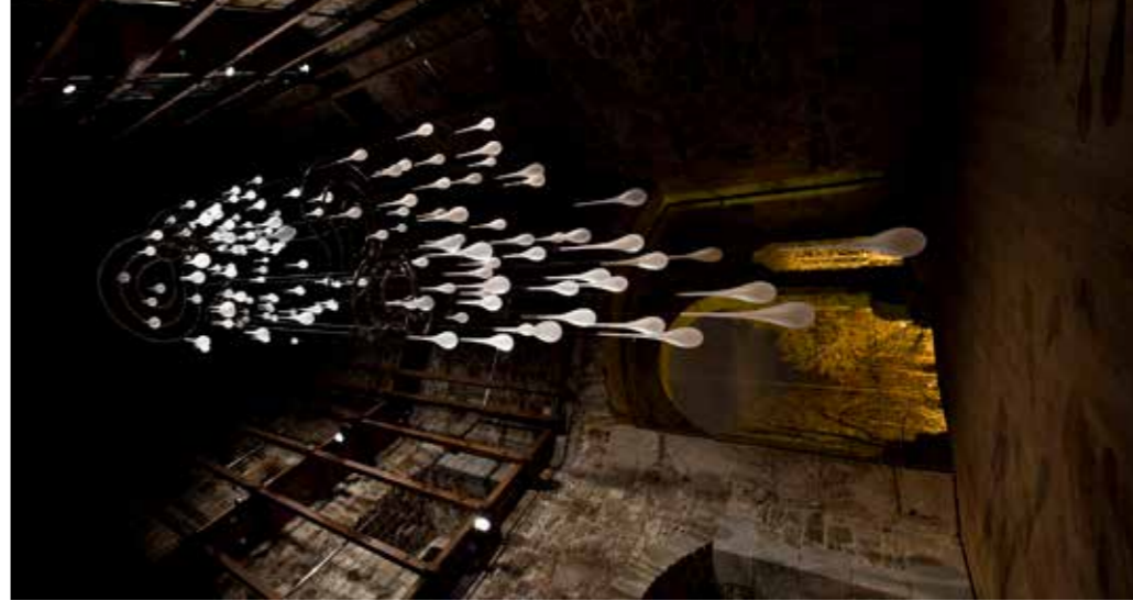
Hip zatem – Alina, prostorska postavitve, peterokotni stolp na Ljubljanskem gradu, steklo, inoks, svetloba, glasba Arvo Pärt (Für Alina), višina 15 m, 2011, fotografija Boris Gaberščik