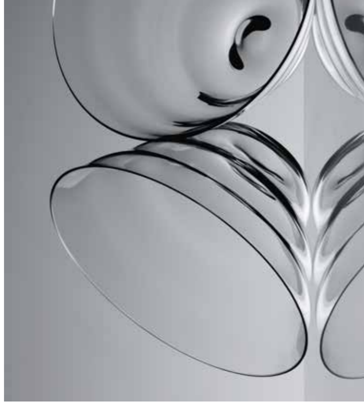
Flow, skodelica