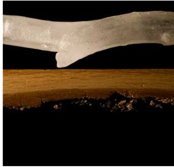
Znotraj – I held my breath but the world kept on dreaming, les, steklo, detajl iz prostorske postavitve na Ljubljanskem gradu, 2012, fotografija Boris Gaberščik

Črna, ki se materializira v steklu, je za Tanjo zemeljska protiutež neskončni in eterični belini. Umetniško izražanje v steklu v tehnikah, ki jih je umetnica skozi ustvarjanje razvila, prenaša v postavitve večjih dimenzij v prostorih z njihovimi lastnimi danostmi. Umetniške instalacije sestavljajo posamezni elementi, ploške, kaplje, čolnčki, oblaki, fluidne forme v prostih kompozicijah, za katere se včasih zdi, da lebdi; pogosto jih spremlja zanje komponirana glasba ali posebna osvetljava. So kot prived, materializirane sanje, in vzbudijo osebni odziv obiskovalcev, ki jim instalacije Tanje Pak postanejo intimna izkušnja.