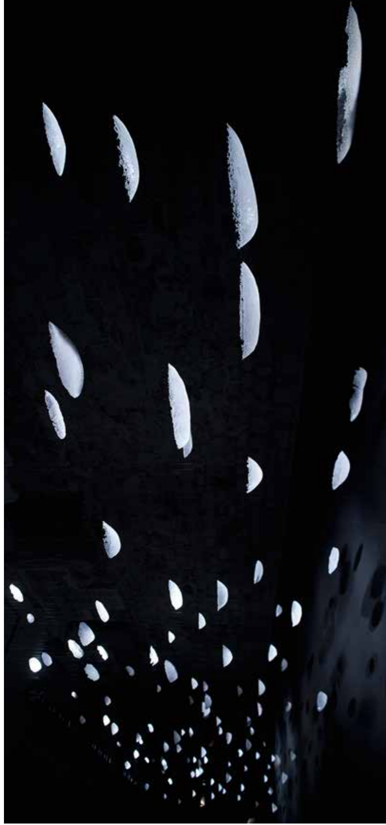
Odsanjanja / Dreaming Away, multimedijnska prostorska postavitve na Ljubljanskem gradu, steklo, svetloba, glasba Arvo Pärt (Spiegel im Spiegel), dolžina postavitve 30 metrov, 2011

prostor dihanja in Biti . V njem izraža odprtost horizontov specifičnih pokrajin, tudi notranjih, in plasti subtilnih občutij.