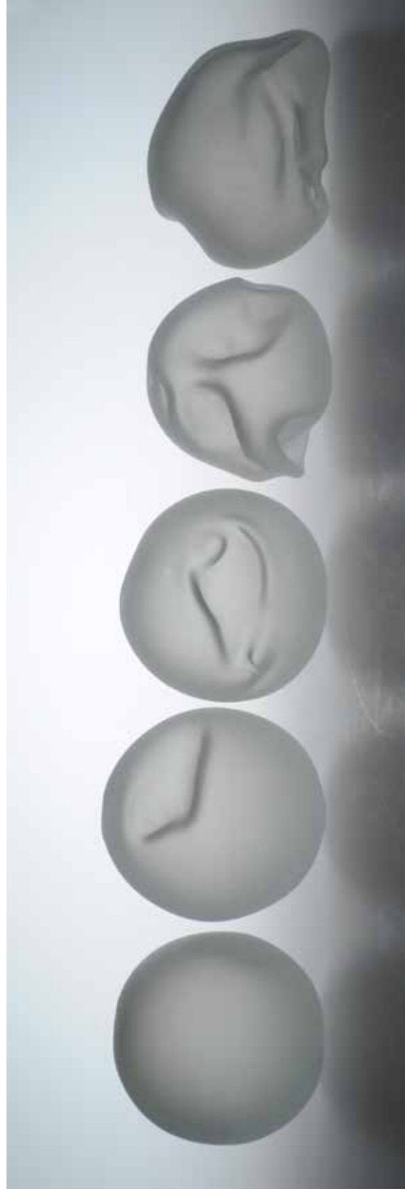
Zgodba o dihu, steklo, 2014–2018, fotografija Tanja Pak